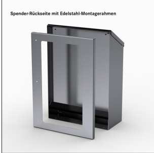
Spender-Rückseite mit Edelstahl-Montagerahmen