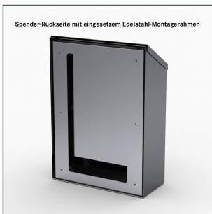
Spender-Rückseite mit eingesetztem Edelstahl-Montagerahmen

hochwertiger, sehr stabiler Spender komplett aus Edelstahl Werkstoff 1.4301, zur sicheren Lagerung und Entnahme von Ärmelschutz / Armüberziehern / Armstulpen lose Schüttung, mit internem Mechanismus zur Vermeidung der Entnahme zu vieler Einwegartikel, Oberfläche gebürstet, Oberflächenrauheit Ra < 0,8 \mu m , hygienische Ausführung mit Schrägdach, fugenfreie Außenwand zur leichten Reinigung, elektrolytisch aufgebrachtes Füllgut-Symbol, einfache Befüllung von oben, mit Füllstandsanzeige, Bestandteil des Sailer-Spendersystems für ein einheitliches Erscheinungsbild, mit Montagerahmen zur einfachen und komplett wandbündigen Montage (ermöglicht u.a. nachträgliches Absilikonieren), passend sowohl für Magnetmontage mit 4 oder 6 Stück Sailer Hygienic Design Magneten als auch für direkte Montage auf die Wand (Magnete oder Wandmontagematerial nicht im Lieferumfang enthalten - bitte gesondert bestellen)