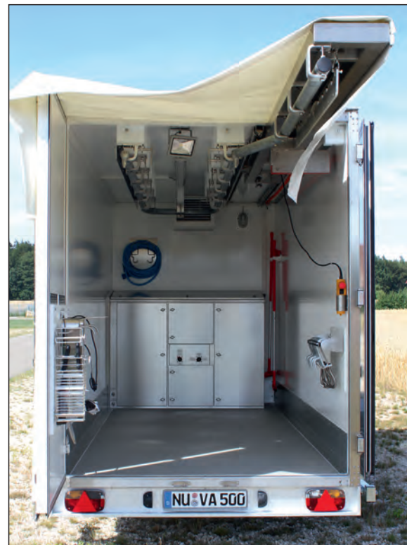
Innenansicht des voll ausgestatteten Wildanhängers mit herausgefahrener Aufbruchstation ►